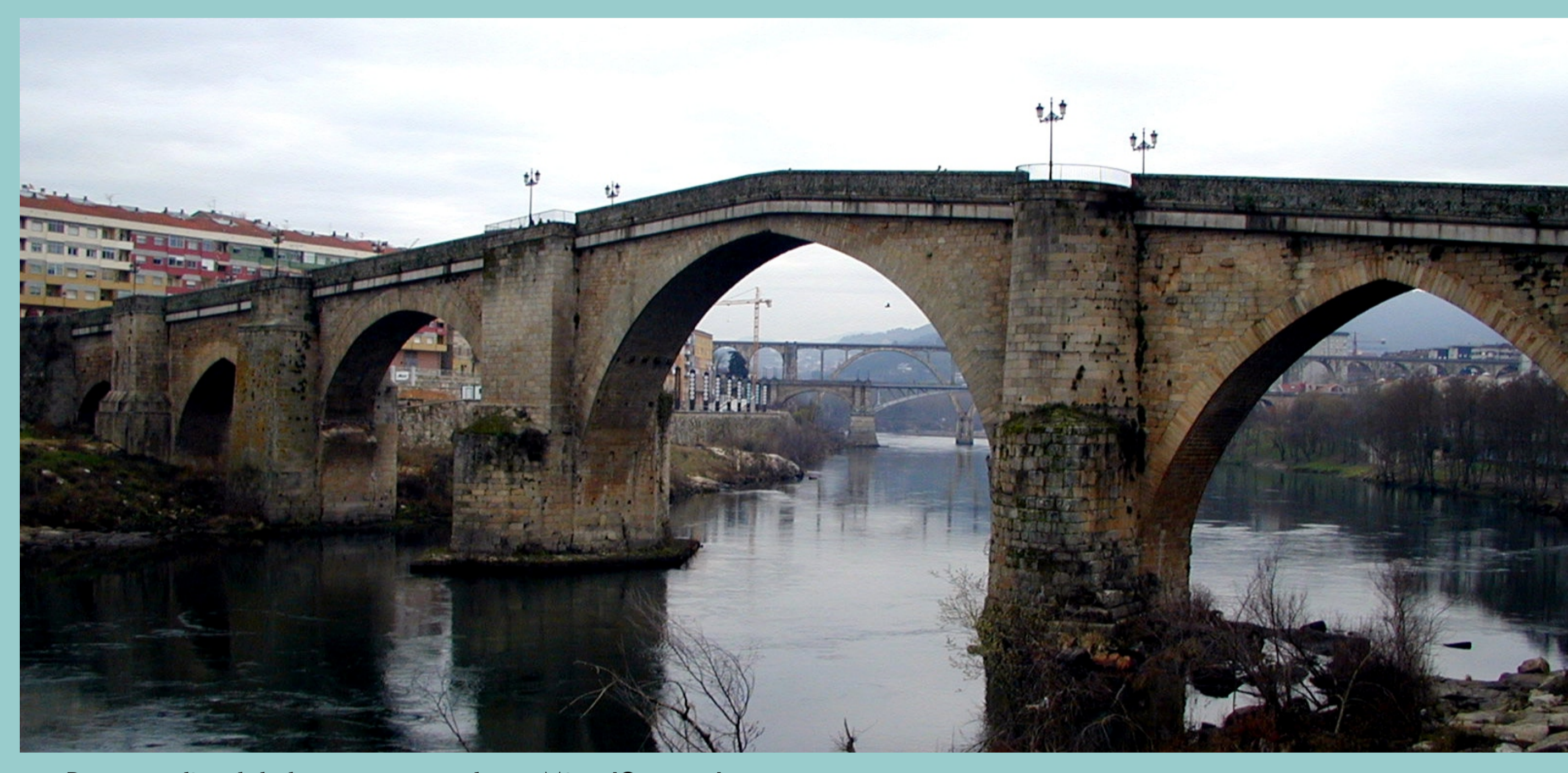
Ponte medieval de base romana sobre o Miño (Ourense)

"Poucas causas máis fermosas inventou o home que as pontes. E arredor da construción de pontes houbo sempre creencias máxicas e ritos específicos porque como creron os gregos antigos, o home tiña que facerse perdoar a violación dun orde divinal, xa que xungüia con unha ponte dúas partes da terra que naceran arredadas por unha corrente de auga... ... Pasan sob os arcos as augas lentas dos nosos ríos. Algunhas datan dos días románs, varias veces reconstruídas pro que quizaves conserven pedras da súa fundación. E digo fundación porque unha ponte fúndase coma se funda unha cidade".