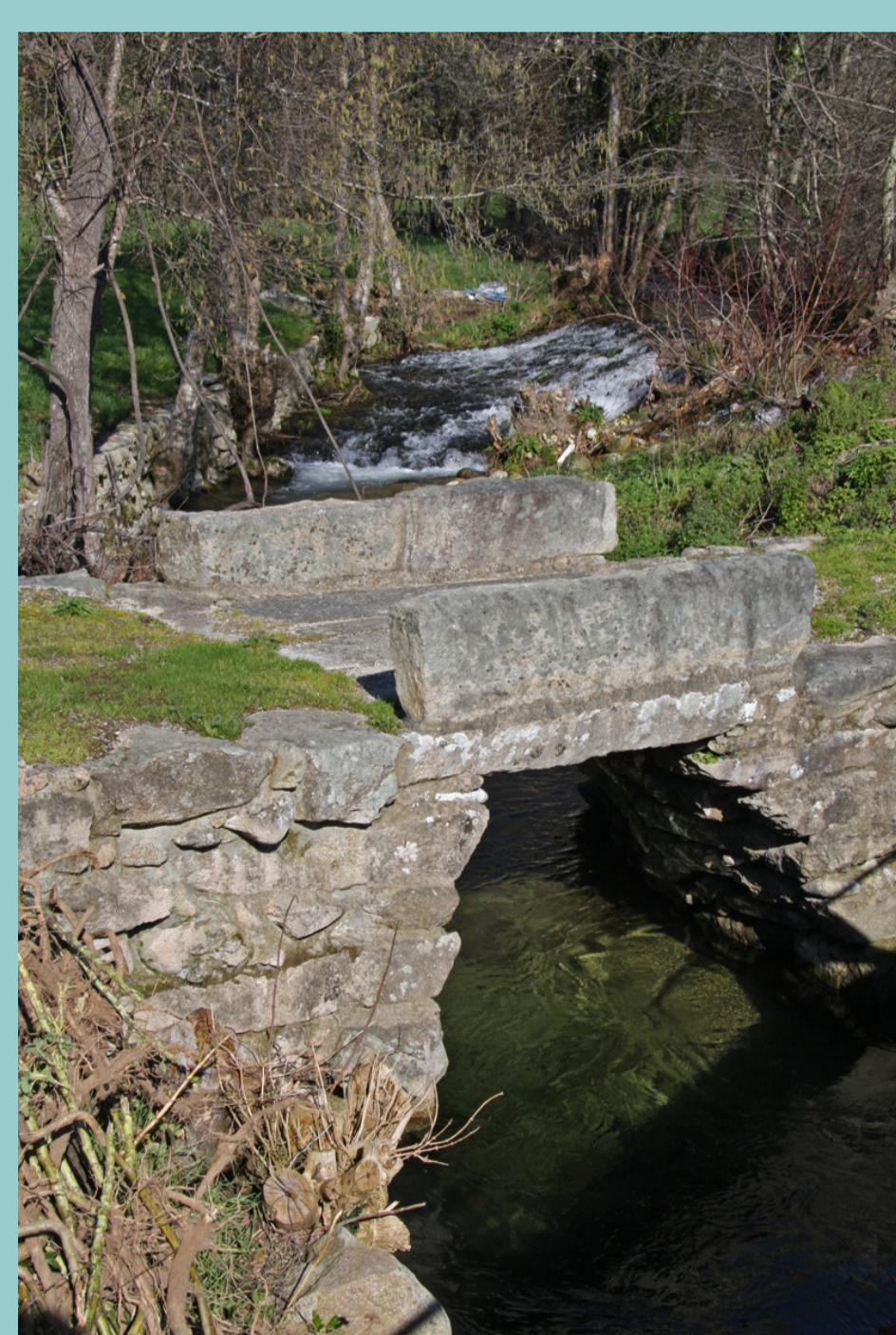
Ponte con falso arco (Outes)

As PONTES son construcións nas que as obras son de máis grande tamaño e a fábrica de mellor calidade. A tipoloxía é moi variada segundo a cimentación, forma das cepas, ménsulas, calzada e pontóns. Así atopamos pontes de cepas redondeadas, apuntadas, falso arco, arcos semicirculares, apuntadas, dun so van, de varios... Algunhas das pontes que cruzan os ríos galegos son da época romana e moitas construídas na Idade Media. Tamén seguen en uso obras dos séculos XVI e XVII, aínda que moitas sufriron transformacións e adaptacións en séculos posteriores. A finais do século XIX construíronse as primeiras metálicas para o ferrocarril e xa no século XX estendeuse o uso do formigón armado na construción de pontes.