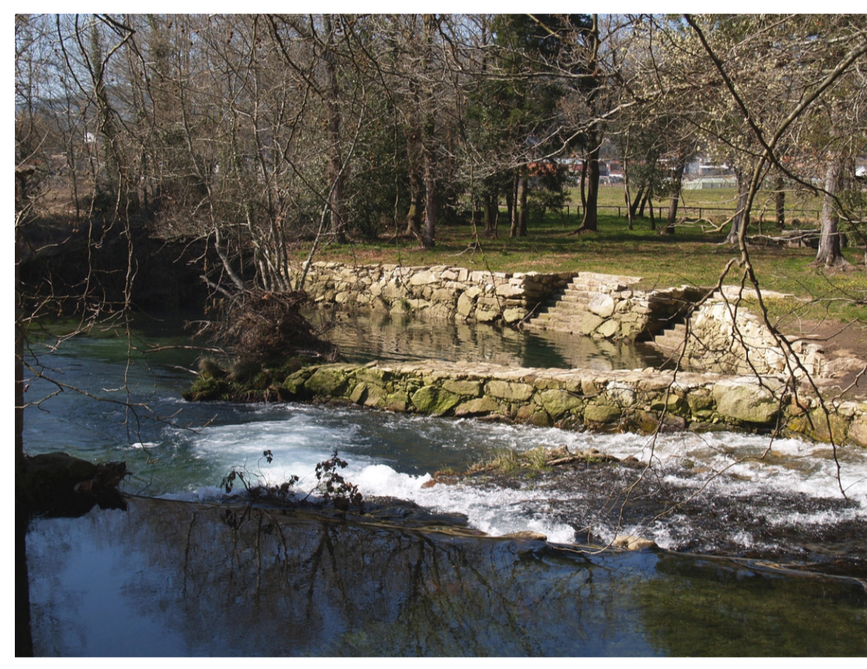
Peirao para o atraque de embarcación e o acceso de persoas e mercadorías.