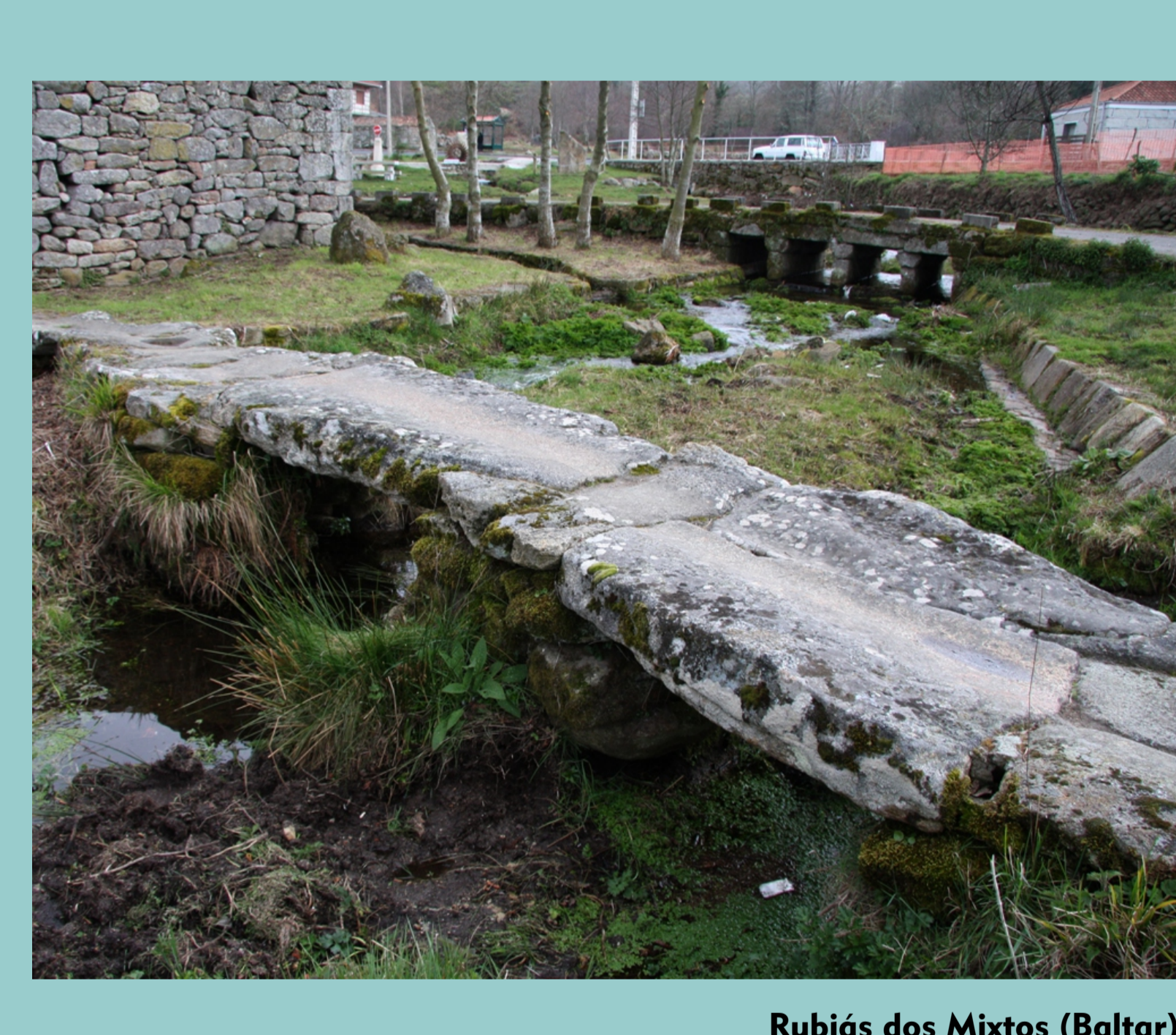
Rubías dos Mixtos (Baltar)

As PONTES son construcións nas que as obras son de máis grande tamaño e a fábrica de mellor calidade. A tipoloxía é moi variada segundo a cimentación, forma das cepas, ménsulas, calzada e pontóns. Así atopamos pontes de cepas redondeadas, apuntadas, falso arco, arcos semicirculares, apuntadas, dun so van, de varios... Algunhas das pontes que cruzan os ríos galegos son da época romana e moitas construídas na Idade Media. Tamén seguen en uso obras dos séculos XVI e XVII, aínda que moitas sufriron transformacións e adaptacións en séculos posteriores. A finais do século XIX construíronse as primeiras metálicas para o ferrocarril e xa no século XX estendeuse o uso do formigón armado na construción de pontes.