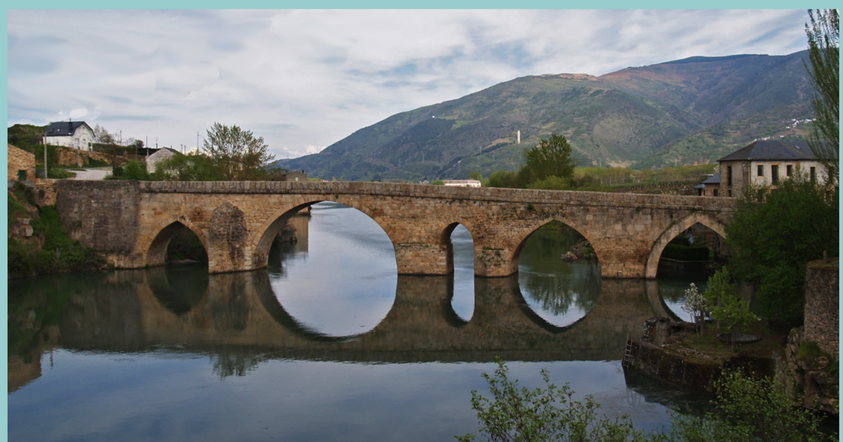
Ponte da Cigarrosa, sobre o Sil (A Rúa-Petín)