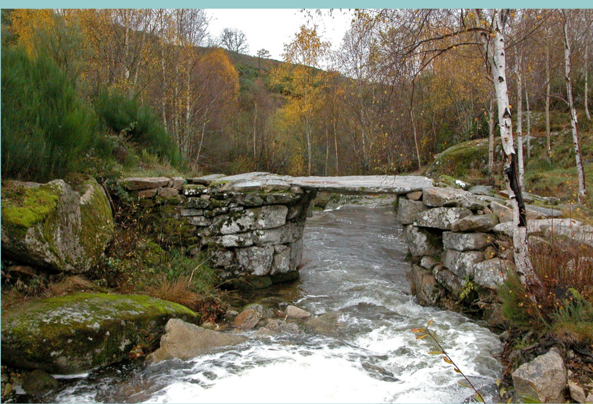
Casteligo (Chandrea de Queixa)

En correntes non moi anchas constrúense PONTILLÓNS, construcións dun so van nas que, sobre dous muros ou estribos situados en ambas beiras, se apoian grandes lousas ou pontóns de madeira como plataforma, coa suficiente anchura para que poida pasar un carro.