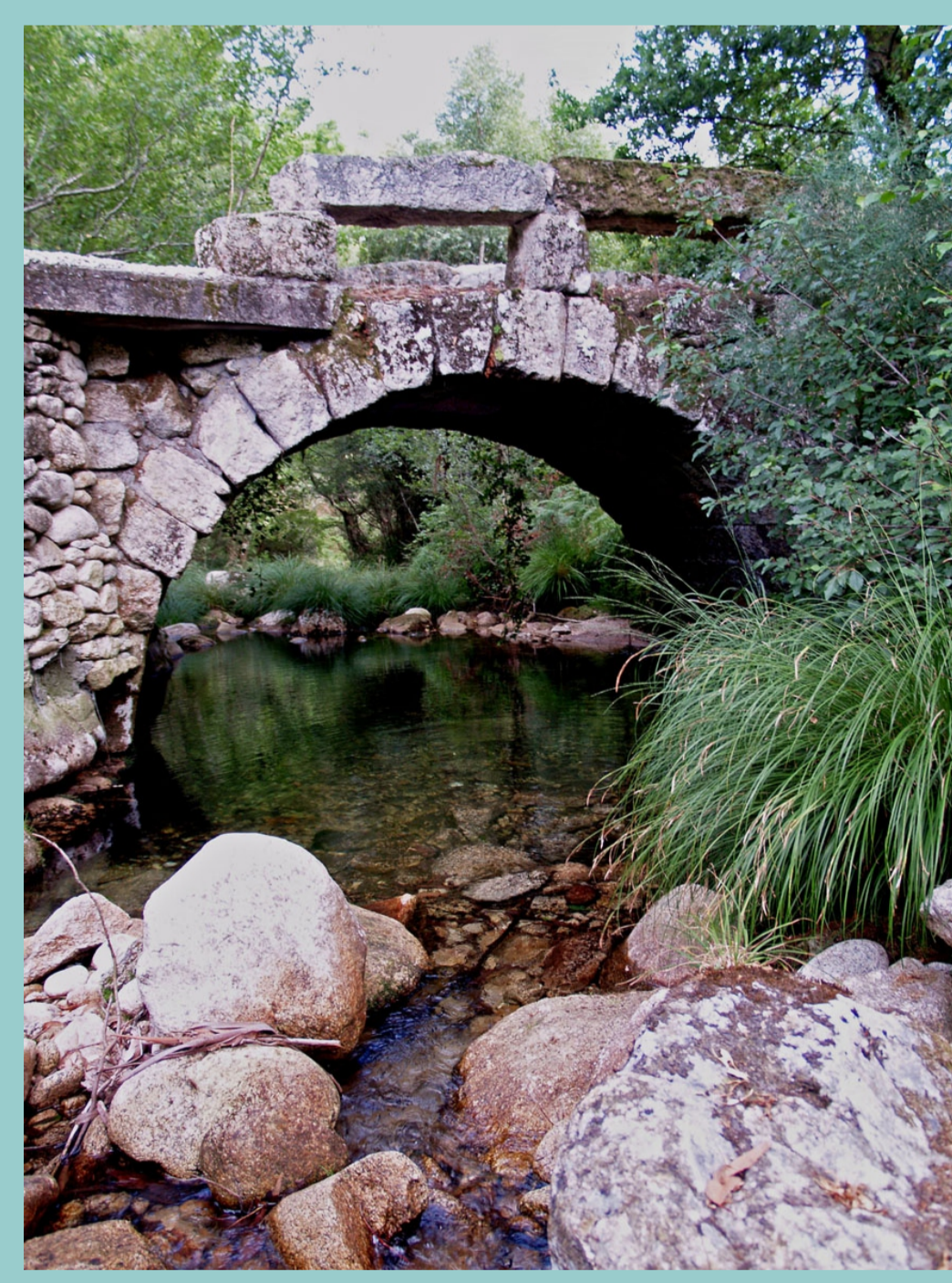
Ponte romana no río Seixo (Cerdedo)