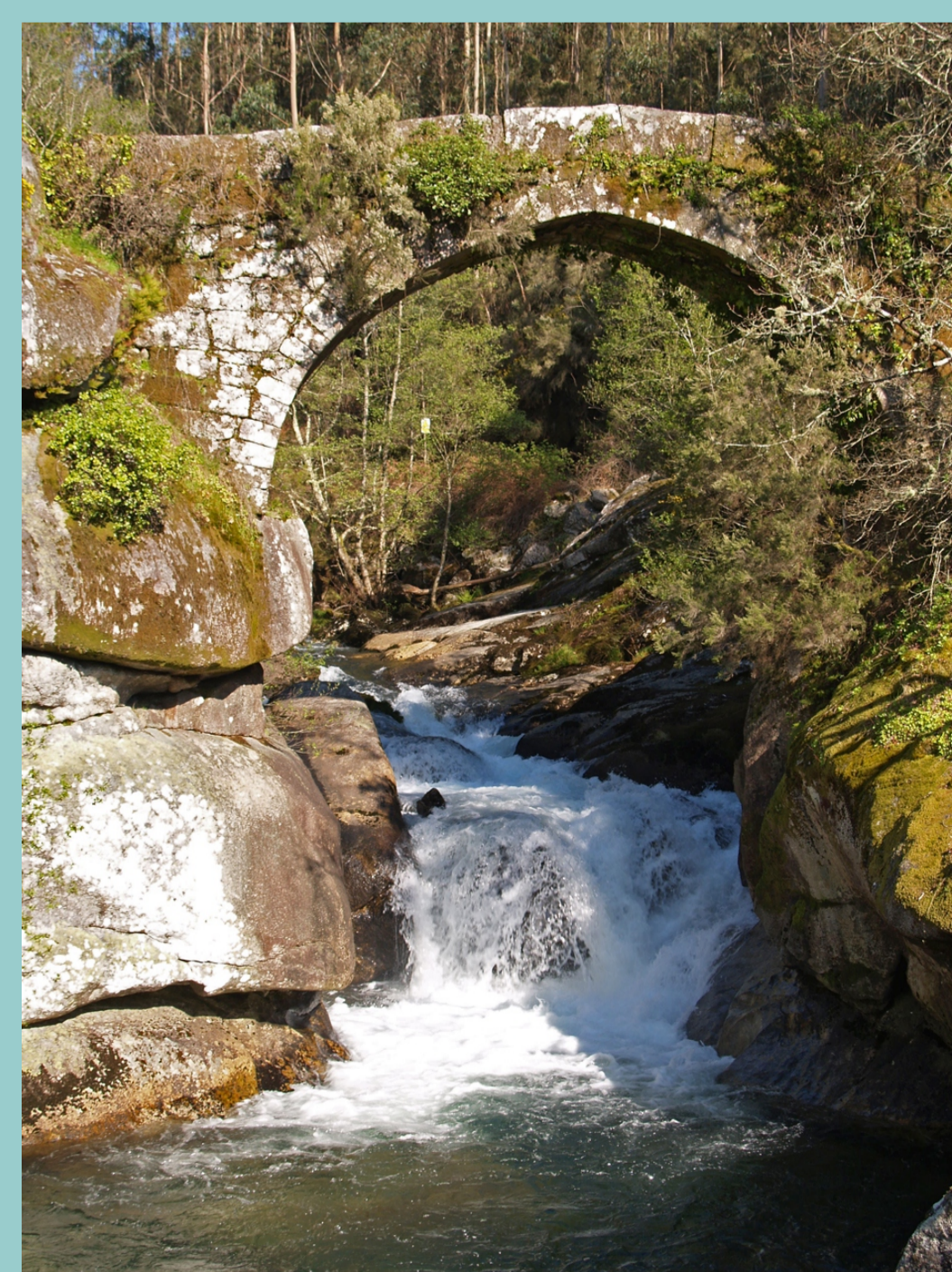
Ponte do Almofrei (Cotobade)