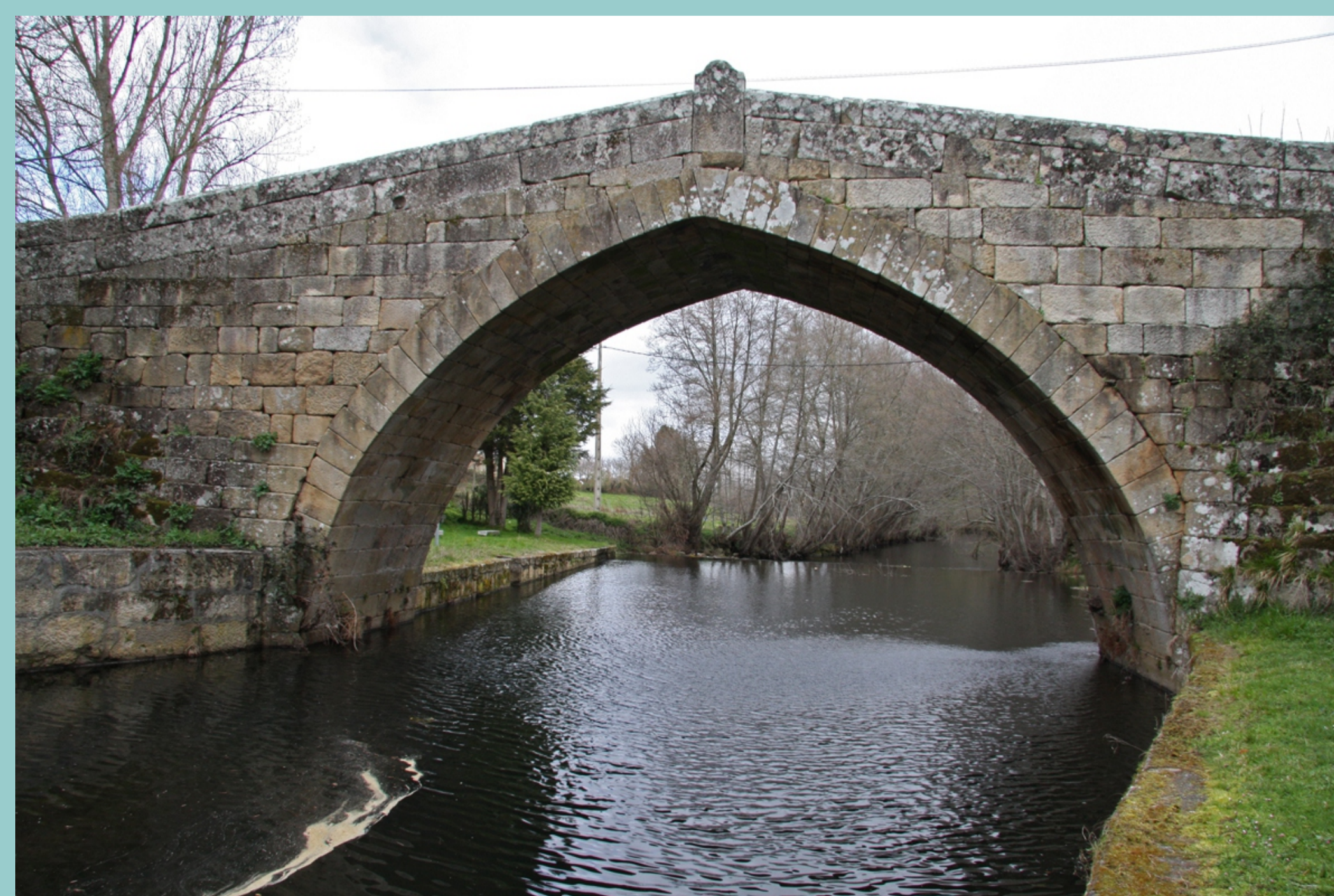
Ponte sobre o Arnoia (Arnuide)