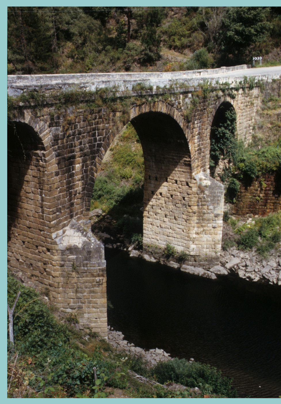
Ponte romana do Bibei (Larouco)