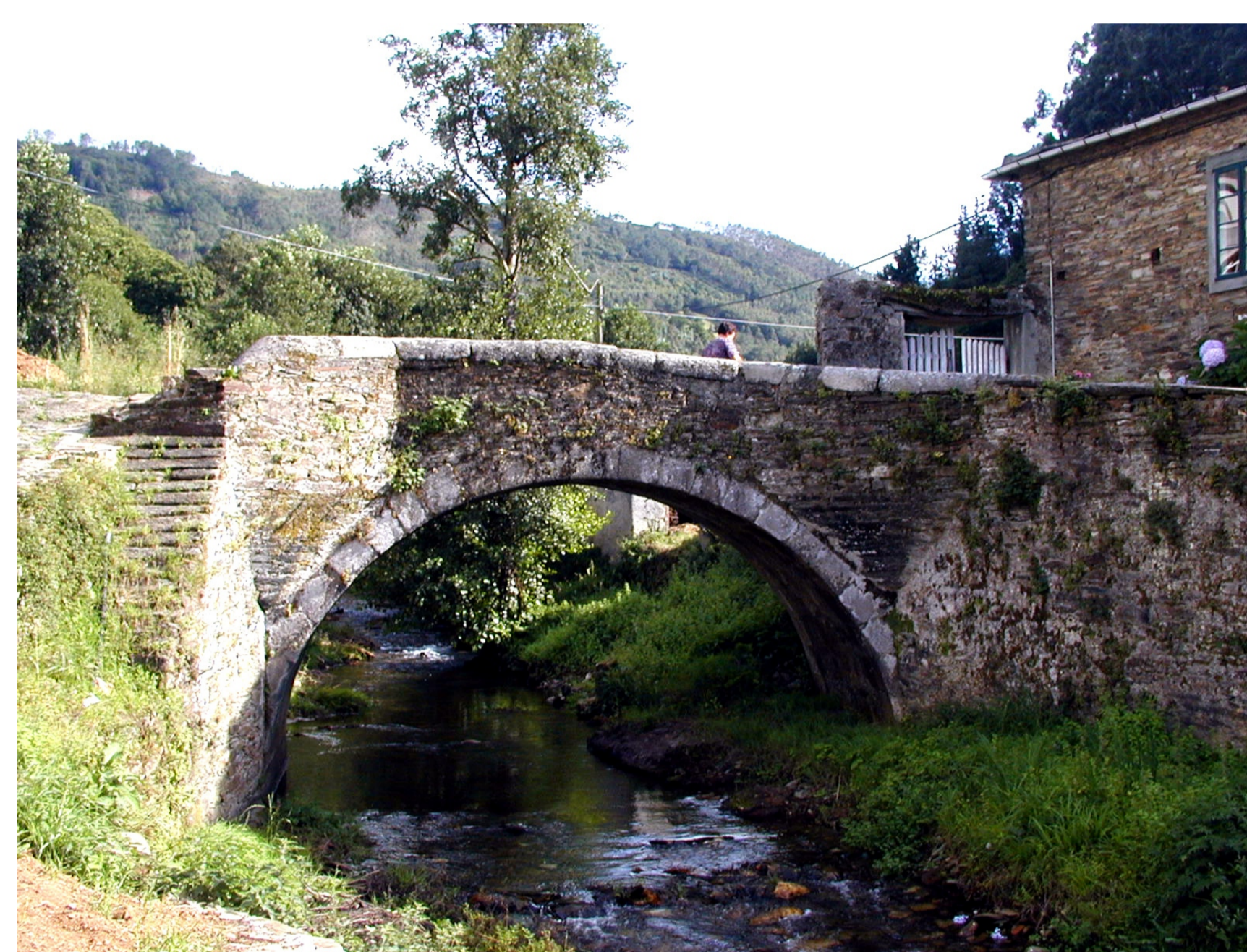
Ponte do Pasatempo sobre o Valiñadares, un afluente do Masma (Mondoñedo). Segundo a tradición, nesta ponte entretiveron á muller de Pardo de Cela cando viña co indulto, sen poder así evitar que mataran ao Mariscal.